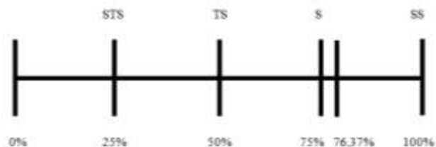
Gambar 1: Skala Likert Gambaran Minat Belajar Siswa

Jadi berdasarkan skala likert dan rata-rata hitung, maka analisis data mengenai gambaran minat belajar siswa kelas XI pada mata pelajaran Pembuatan Busana Wanita adalah 76,37% dengan nilai rata-rata 9,17 yang berada pada rentang nilai 75%-100 %. berarti tingkat minat belajar siswa pada mata pelajaran Pembuatan Busana Wanita dikategorikan sangat tinggi.