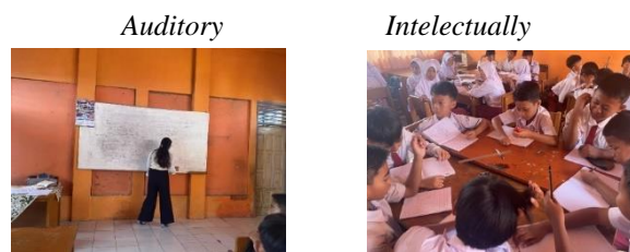
Gambar 1. Aktivitas Guru dan Siswa pada Tahap Auditory dan Intellectually Pertemuan I

Meier dalam (Huda, 2013) menyebutkan telinga ( auditory ) lebih cepat menangkap dan menyimpan informasi.