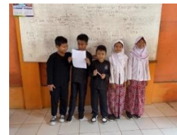
Gambar 2. Aktivitas Siswa pada Tahap Auditory (Persentasi di Depan Kelas) Pertemuan I

Kemudian pada tahap kedua Intellectually diberikan waktu untuk siswa dapat bertanya terkait materi yang telah disampaikan. Sebagian siswa masih enggan untuk bertanya sehingga untuk membangun semangat dan keaktifan siswa, guru melakukan ice breaking sebagai alternatif untuk siswa bernilai berekspresi. Kemudian diberikan LKS untuk dikerjakan bersama kelompok. Siswa menggunakan kemampuan berpikir intellectually untuk memecahkan masalah, menemukan informasi ataupun menciptakan pertanyaan. Kemudian secara siswa bergiliran menjelaskan hasil diskusi dan kelompok siswa lainnya bertugas untuk mendengarkan ( auditory ).