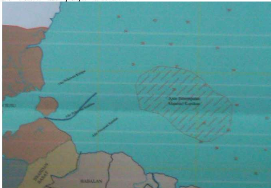
Gambar 5. Lokasi penempatan material kerukan di laut.

Penempatan material kerukan direncanakan adalah di laut. Lokasi penempatan lumpur material kerukan di laut ditetapkan oleh instansi yang berwenang. Setelah sampai di lokasi penempatan material kerukan maka seluruh material keruk dikeluarkan melalui pintu khusus di dasar lambung. Lokasi yang memungkinkan menjadi area penempatan material kerukan adalah di laut kedalaman lebih dari 20 m. Lokasi penempatan material kerukan di laut adalah sebagaimana tertera pada Gambar 5. Setelah Barge kosong, maka kapal kembali ke lokasi pengerukan untuk melakukan pengerukan kembali.