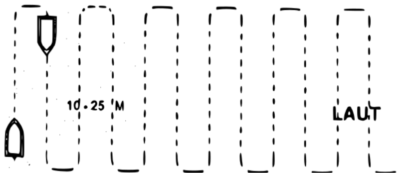
Gambar 2. Ilustrasi pergerakan perahu menyusuri jalur sounding .

Jalur sounding merujuk pada rute kapal yang melakukan sounding dari titik awal hingga titik akhir di suatu kawasan survei. Jarak antara jalur sounding disesuaikan dengan tingkat resolusi yang diinginkan, umumnya berkisar antara 20 hingga 50 meter. Setiap jalur sounding melibatkan pengambilan data kedalaman perairan setiap 5 hingga 10 meter. Titik awal dan akhir dari setiap jalur sounding dicatat, dan data tersebut diinput ke dalam perangkat pengukur yang dilengkapi dengan Echosounder Raytheon tipe DE-719C . Perangkat ini digunakan sebagai referensi perjalanan motorboat sepanjang jalur sounding . Gambaran contoh dari jalur sounding di kawasan survei dapat ditemukan dalam Gambar 2.