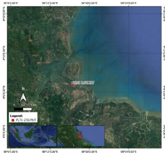
Gambar 1. Lokasi penelitian.

berbatasan dengan Pulau Sumatera yaitu Kecamatan Pangkalan Susu. Pada daerah ini ditemukan adanya tumbuhan mangrove sebagai vegetasi tutupan lahan di sepanjang garis pantai dan di lokasi ini adalah lokasi PLTU 2 Sumut sebagai tujuan pengapalan batubara. Sedangkan pada arah Utara berbatasan dengan Pulau Sembilan.