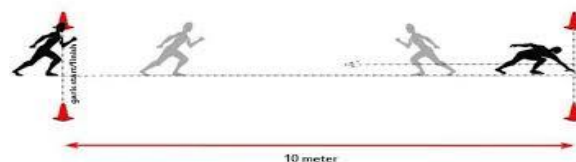
Gambar 1. Lintasan shuttel run

Penelitian ini diadakan di lapangan bulutangkis PB. PT. Satu Kota Kisaran, Kabupaten Asahan, Sumatera Utara yang masih aktif melakukan latihan atlet bulutangkis. Penelitian ini dilaksanakan selama 4 minggu atau 1 bulan, penelitian di mulai pada tanggal 09 Januari 2023 sampai 10 Februari 2023. Frekuensi latihan sebanyak 3 kali dalam seminggu. Jumlah sesi latihan sebanyak 12 kali. Jadwal latihan PB. PT. Satu pada hari Senin, Rabu, dan Jumat. Latihan mulai pada pukul 16-18 WIB. Subyek dalam penelitian ini sebanyak 15 atlet bulutangkis PB. PT. Satu. Instrument yang digunakan dalam mengukur kelincahan adalah shuttel run .