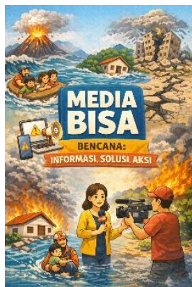
Gambar 1. Tampilan Utama Media BISA